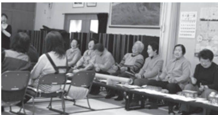
たくさんの方から「この日を楽しみにしている」との声が聞かれました。

会の前日には、福祉推進委員の2人が参加予定となっている方へ、電話連絡して促すだけでなく、コミュニケーションをとる良い機会になっているとのことでした。