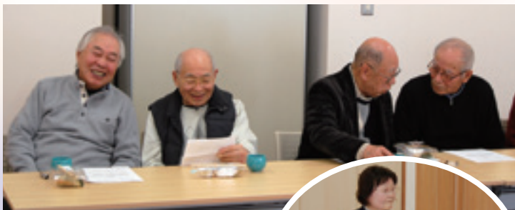
声かけにより、最初は少なかった男性参加者も徐々に増えてきました。