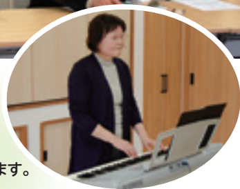
委員の伴奏で歌を歌って楽しめます。