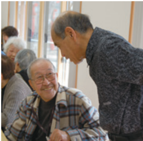
交流を楽しみ、話に花を咲かせています。

80歳以上の身体的な理由などから普段、地域の集まりや交流の場等に参加していない方に対して、地域に出る機会作りに取り組んでいるのが「ひだまりの会」です。自分の体力に合ったレクリエーションを楽しみながら、同世代と交流することで、健康で明るい生活を送ることを目的としています。