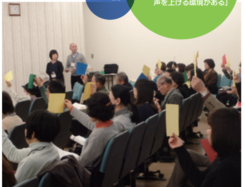
設問に対して5色の紙を使い回答してもらいました。