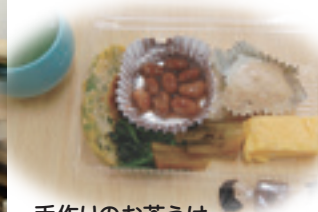
手作りのお茶うけ

参加者は、「普段買い物くらいしか外に出ないが、この会に声をかけてもらう事で外に出る良い機会となっている」「まだ始まったばかりだが、今後も運営委員さんに会を続けていってほしい」など、この会をとて楽しんでいっている様子がうかがえました。 運営委員は名前前の通り「ひだまり」のような温かさで参加者を迎え、和ませています。