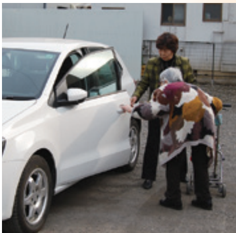
歩行の補助や安全に配慮して、必要があれば運営委員が車で送迎しています。

平成28年6月に第1回目を行い、毎月第1日曜日に行われています。開催に当たっては、運営委員が案内のチラシを直接配って呼びかけており、毎回20人前後が足を運びます。1月と2月の間は、寒さが厳しく足元も悪い為、会はお休みとなっていました。2か月ぶりの開催となる3月の会は、心地よい春の陽気の中で行われました。お茶飲み会に加え、毎回歌を歌ったり、ゲーム、体操を取り入れた回もあり、今回は手話ダンスサークル「マロン」の皆さんが手話ダンスで会場を盛り上げていました。