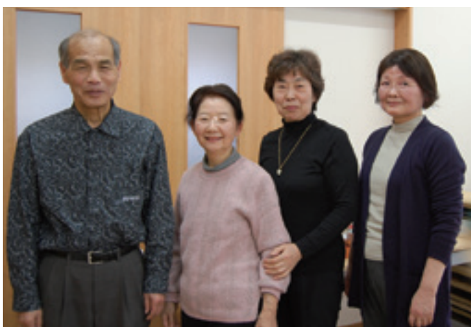
地域に出る機会作りとして、会を企画している運営委員の皆さん