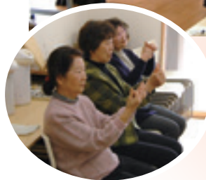
会場を盛り上げる手話ダンスサークル「マロン」の皆さんと手話ダンスを覚えている運営委員の皆さん