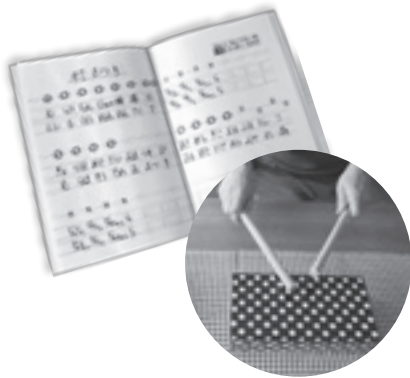
会の中で使用する楽器や楽譜などは手作りしています。