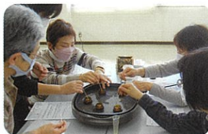
アロマクリームづくり