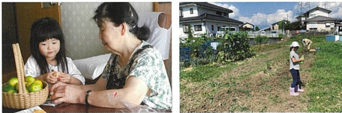
提供会員や依頼会員宅での預かり