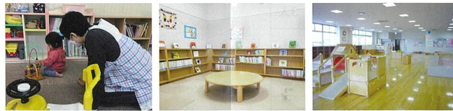
上田市内 子育て支援センターや子育てひろば